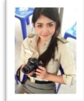
มะลิวิไลย์ บุตรดี ประจำฝ่ายปฏิบัติการ